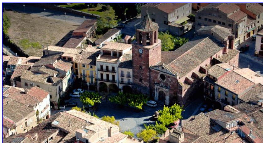
Vista del centro de Prades