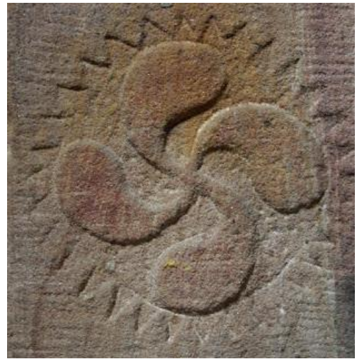
Un «lauburu» (esvástica de brazos curvilíneos) en una pila bautismal... de Alemania