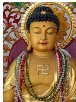
Mosaico romano adornado con una esvástica y representación de Buda con una esvástica levógira en la India

La cultura vasca sobrevive gracias a Roma. Así, estas teorías vasco-cantabristas vendrían a decir que cuando los romanos hablaban de la resistencia de los pueblos cántabros a su dominio, en realidad estaban confundidos y se referían a los vascos. Así explicaban por qué el idioma y la cultura de los cántabros habían desaparecido, mientras que el idioma y la cultura vascos seguían existiendo hoy. Supongo que es más fácil llegar a esta conclusión que ver que si los vascones no sólo no desaparecieron como pueblo, sino que acrecentaron su poder bajo el Imperio, fue precisamente porque colaboraron con los romanos.