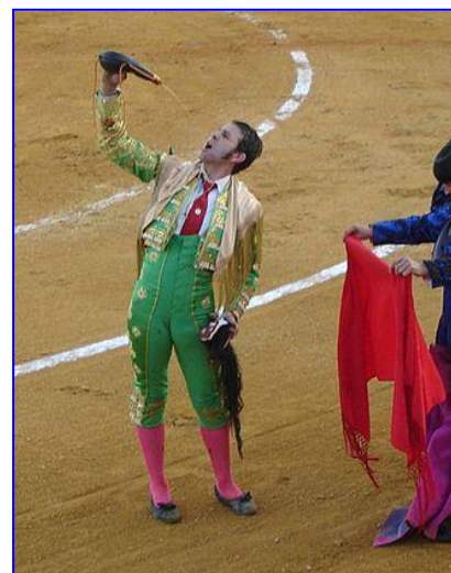
Juan José Padilla bebe de la bota que le ha lanzado un espectador como homenaje a la faena que fue premiada con el rabo del astado

Sabido es que la bota, de la familia de los odres o corambres, en tamaño reducido, es un recipiente utilizado para contener cualquier clase de líquido, de piel de cabra cosida a mano y recubierta en su interior con pez y brocales de asta de todo torneada. El tiempo, la modernidad y el turismo han adulterado la confección de este recipiente tan clásico y