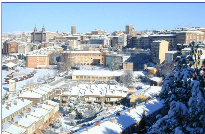
Ciudad de Teruel, España

Esa labor importante que con el tiempo probablemente hubiera llegado a más, se vino abajo con la soñada Transición, que trajo la desaparición del Instituto de Cultura Hispánica y su sustitución por una impersonal Agencia Española de Cooperación Internacional para el Desarrollo, cuyos fines se alejan de los mantenidos por el Instituto.