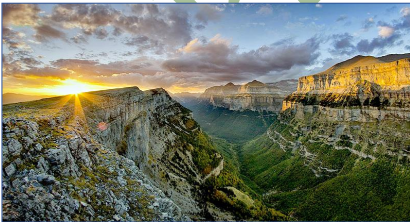
Valle de Ordesa (Pirineos), Huesca, España

Siempre que recibo una carta tuya o un artículo para las publicaciones que hacemos, son un relajo para el espíritu, pues todas ellas destilan cordura y una paz considerable, que invitan a seguir tus pasos, lo que no puede ser porque vivimos en dos mundos distintos, mundos que se encuentran en estos momentos sumidos en la anormalidad y falta de visión de futuro, razón por la que la convivencia no resulta fácil.