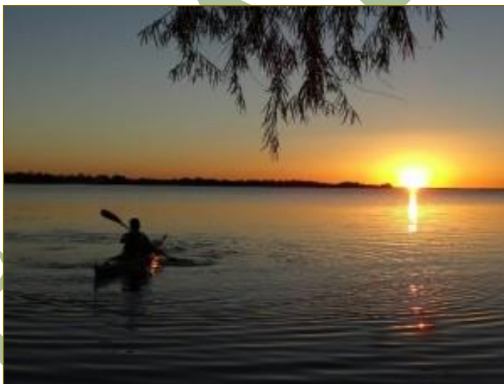
Lago en la Reserva nartural de Iberá, Corrientes, Argentina