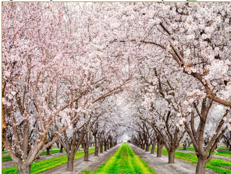
Floración de los cerezos en el Valle del Jerte, Ávila, España

Al morir Franco –llorado por gran parte de población, aunque luego pudiéramos pensar fueran con lágrimas de plañidera–, todos sabíamos que se produciría un cambio. Los que habían vivido la paz de