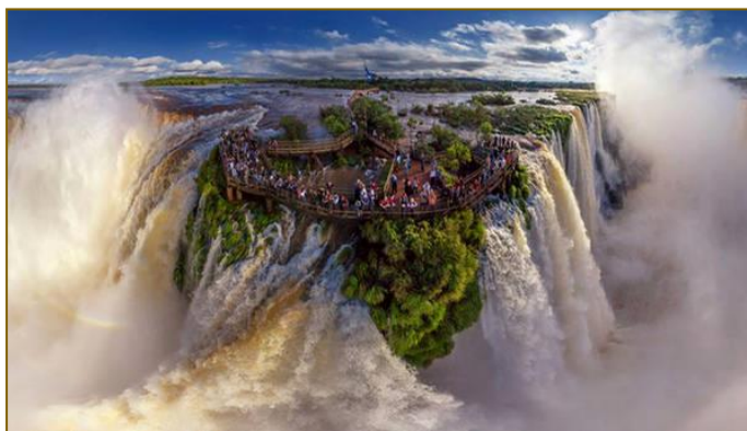
Cataratas de Iguazú, Misiones, Argentina

Comencé diciéndote que te escribo de «este lado del mundo» y no sólo ni principalmente para referirme a la diferencia de huso horario. Me interesa, ahora, subrayar otro «huso», otro punto de visión que tenemos desde aquí quienes, por la gracia de Dios, fuimos educados desde nuestra juventud en el amor a España y a su historia, respecto del 18 de Julio. Por cierto que la visión peninsular de los hechos nos resulta más que benéfica y bienvenida porque nos permite un ajuste crítico respecto de hechos y de personas que, a veces, tendemos a idealizar o a rodear de un cierto halo de leyenda. Pero me parece que sería bueno que vosotros, los españoles de la Península, tuvierais en cuenta algo que, quizás por la proximidad, no aparezca con la fuerza que merece.