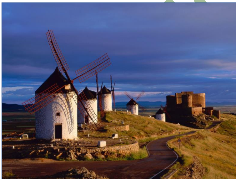
Molinos de viento en Consuegra, La Mancha, España

Es cierto lo que apuntas respecto a la forma que por aquí se ve a Franco. Según estas nuevas generaciones, que han recibido una enseñanza de la Historia de España absolutamente manipulada, y escasa, Franco fue un ser despreciable, asesino, opresor, que mantuvo a la población española como en un redil donde nadie se podía mover o hablar libremente, casi esclavizada. Y están en esas. Nadie