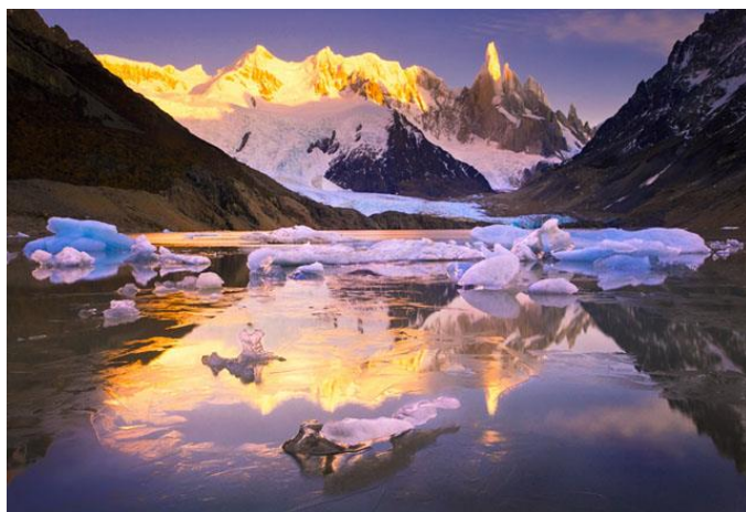
Amanece sobre el Cerro Torre, Patagonia, Argentina