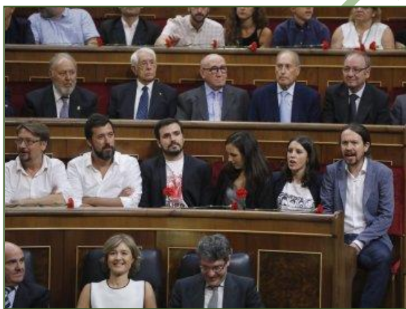
Los parlamentarios de Podemos no muestran demasiado entusiasmo ante la presencia de Felipe VI

Aprovechar esa fecha para el homenaje debido, cuando ni a Podemos ni a ninguno de sus socios se les había ocurrido antes, sólo tiene dos explicaciones. La benévola, que esa imaginativa fuerza política suele utilizar este tipo de recursos para hacer sobresalir su mensaje. La peor pensada,