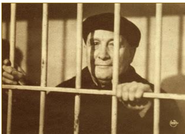
Largo Caballero en la cárcel por su responsabilidad en la revolución de Asturias

Dice la propaganda socialista, aún siguen con la misma mentira, que esta revolución fue debido a la entrada en el Gobierno, que dirigía Alejandro Lerroux, de tres miembros del partido de la CEDA que lideraba el dirigente derechista José María Gil Robles. Sin embargo esta patraña no se la cree cualquier persona con dos dedos de frente. Una revolución como aquella no se proyecta de la noche al día. Se necesitan muchos meses de preparación: comprar armas, pertrechar a la gente, etc. Un sindicalista, miembro de la dirección nacional de UGT, Amaro del Rosal, dice que aunque invocaron aquella disculpa les hubiera valido lo mismo otra excusa o justificación porque la decisión de desencadenar la revolución ya estaba tomada desde mucho antes: «En el trabajo organizativo se llevaba más de ocho meses cuando estalló el movimiento. En los cuadros de organización estaban involucrados cientos de elementos pertenecientes a la UGT, al PSOE, a las Juventudes Socialistas...».