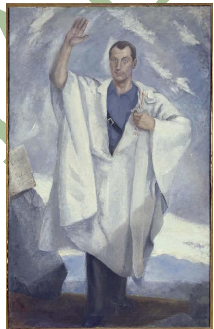
José Antonio por Daniel Vázquez Díaz

Como acontece hoy en más de una estirpe, en los Primo de Rivera el juego relativo de la proporción entre bizarría y madurez parece haber sido inverso a lo previsible. Mientras en el antecesor hubo de encantarnos una gracia de hijo de familia, la dignidad del pater familias llena de sentido las horas supremas y las palabras supremas del sucesor. De José Antonio no nos es menos útil que el ejemplo, en que dinamiza la energía de un impulso, el modelo, donde se canoniza la perfección de una elegancia 12 .