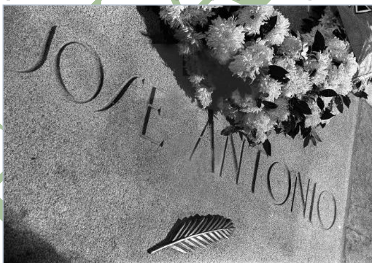
Lápida bajo la que yacen los restos de José Antonio en el Valle de los Caídos

La más profunda entre las palabras que, en el breve curso de su heroico vivir, pronunciara nuestro José Antonio, es aquella por la cual se proclama; «Queremos a España porque no nos gusta». Esa paradoja vale para una crucifixión. La afrenta y la adoración conjugan su ambivalencia en la misma. La corriente vertical de un amor se ve atajada por la cortadura horizontal de un disgusto. Un frío Adaja quiebra la corriente de un impetuoso Duero. Es ésta la Patria que se puede cantar en unos Juegos florales con la cruz por numen. La Patria superada por una vocación de imperial unidad. No la espontánea, la intuitiva, la del sentimentalismo chauvin , la de las griterías y las algaradas, la de las nostalgias y los paisajes. Nunca la de los varios nacionalismos... Ved el Mundo: la guerra nos presenta hoy el gigantesco espectáculo de las naciones, de las patrias, que sienten la necesidad de su propia crucifixión y, ante esta necesidad, vacilan. ¿qué son hoy Francia o Polonia? Unas Patrias en el Huerto de los Olivos. Que dicen: «Si es posible, pase de mí este Cáliz». Pero no es posible 17 .