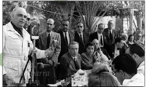
Homenaje a Eugenio d'Ors en 1940

Ahora bien: el clásico del sufragio universal es, nadie lo ignora, Juan Jacobo Rousseau. Y corrientemente se atribuye a Rousseau un criterio «voluntarista» sobre el punto. En ello insistía sacando de tal atribución importantes consecuencias, don José Antonio Primo de Rivera en un valiente discurso donde se definía el sentido, si no el programa, de una fuerza nueva, que se dispone a actuar con brío en la política española... 9 .